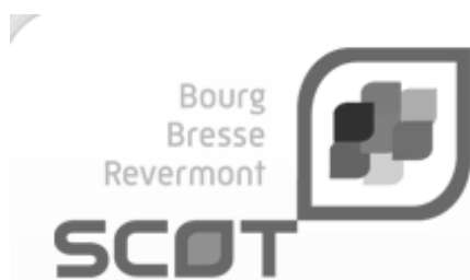
Schéma de Cohérence Territoriale (SCOT)